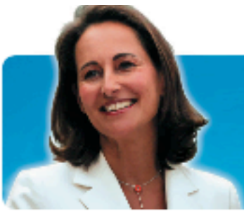
Ségolène Royal candidate à l'élection présidentielle