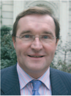
Germinal Peiro, secrétaire national à l'agriculture