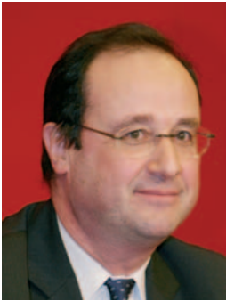
François Hollande, Premier secrétaire du Parti socialiste

L'agriculture, depuis ces vingt dernières années, a connu des changements profonds et des réformes successives.